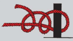
Zwei halbe Schläge

Dient zum Belegen von Festmachern auf Pollern, an einer Reling und anderen festen Gegenständen und ist meistens mit zwei halben Schlägen gesichert