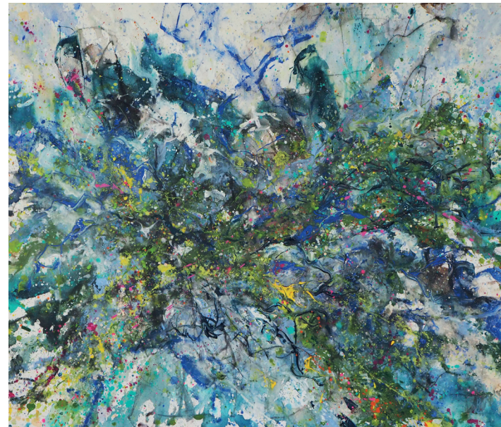
Sophie Englmaier: Wilde Wasser Untersberg, 2023

Einen Teil ihrer Arbeiten, darunter figürliche Studien, präsentiert Sophia Kirst auf ungewöhnliche Art und Weise: Sie zeigt Vorstufen ihrer Bilder, eingerollt und dem gängigen Aufhängesystem entzogen, in Kartonrollen mit der Aufschrift „Vorsicht Kunst“. Die Bilder können von den Betrachtern aus den Rollen genommen, angesehen und zurück in die Rollen gegeben werden. Diese Zeichnungen gewähren einen persönlichen Einblick in das Zeichenbuch der Künstlerin – und mit der Handlungsaufforderung an die Betrachter auch eine ihrer charakteristischen Herangehensweisen.